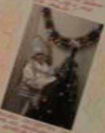
Вот так мы отдыхаем!