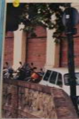
Для автомобилиста - мечта! Машинистика - супер стар.