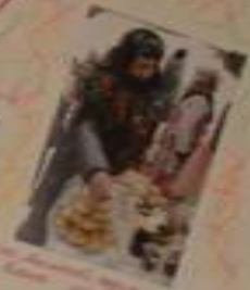
Вот так мы отдыхаем!