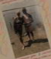
Вот так мы отдыхаем!