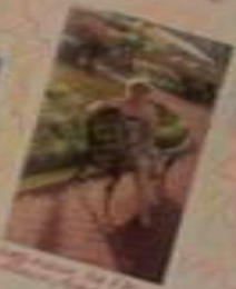
Вот так мы отдыхаем!