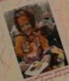
Вот так мы отдыхаем!