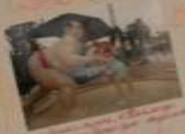
Вот так мы отдыхаем!