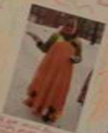
Вот так мы отдыхаем!