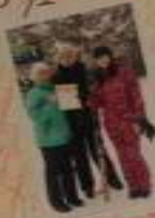
Вот так мы отдыхаем!