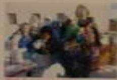
Вот так мы отдыхаем!