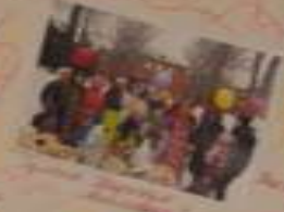
Вот так мы отдыхаем!