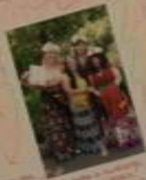
Вот так мы отдыхаем!