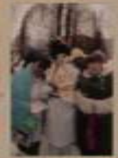
Вот так мы отдыхаем!