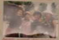
Вот так мы отдыхаем!