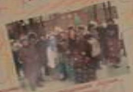
Вот так мы отдыхаем!