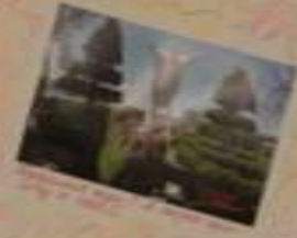
Вот так мы отдыхаем!